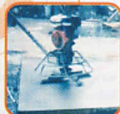
Floorhardener พื้นฟลออร์ฮาร์ดเดนเนอร์