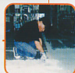
Epoxy Flooring พื้นอีพ็อกซี