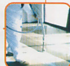
Cement Self leveling ซีเมนต์ปรับระดับ